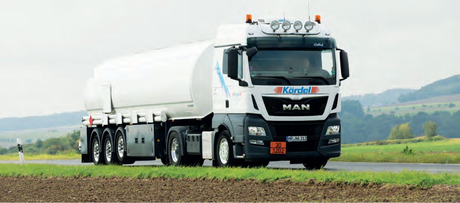
Transporter für chemische Stoffe > Trucks for chemical goods